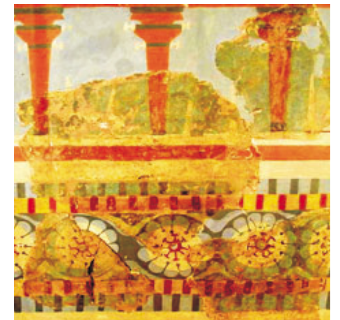
Freskórészlet (Kréta, Knósszosz, 2006, sz.)

A krétaiak megtisztították a kalóztól a Földközi-tengert, szigetükön – Homérosz után – kilencven város fölött uralkodtak! Ezek a tehetséges emberek építették Kréta nagyszerű palotáit, készítették az ott talált gyönyörű kincseket. Ők maguk eltűntek, de műveik – ha romokban is – itt maradtak, hogy a későbbi korok lakói megcsodálhassák azokat.