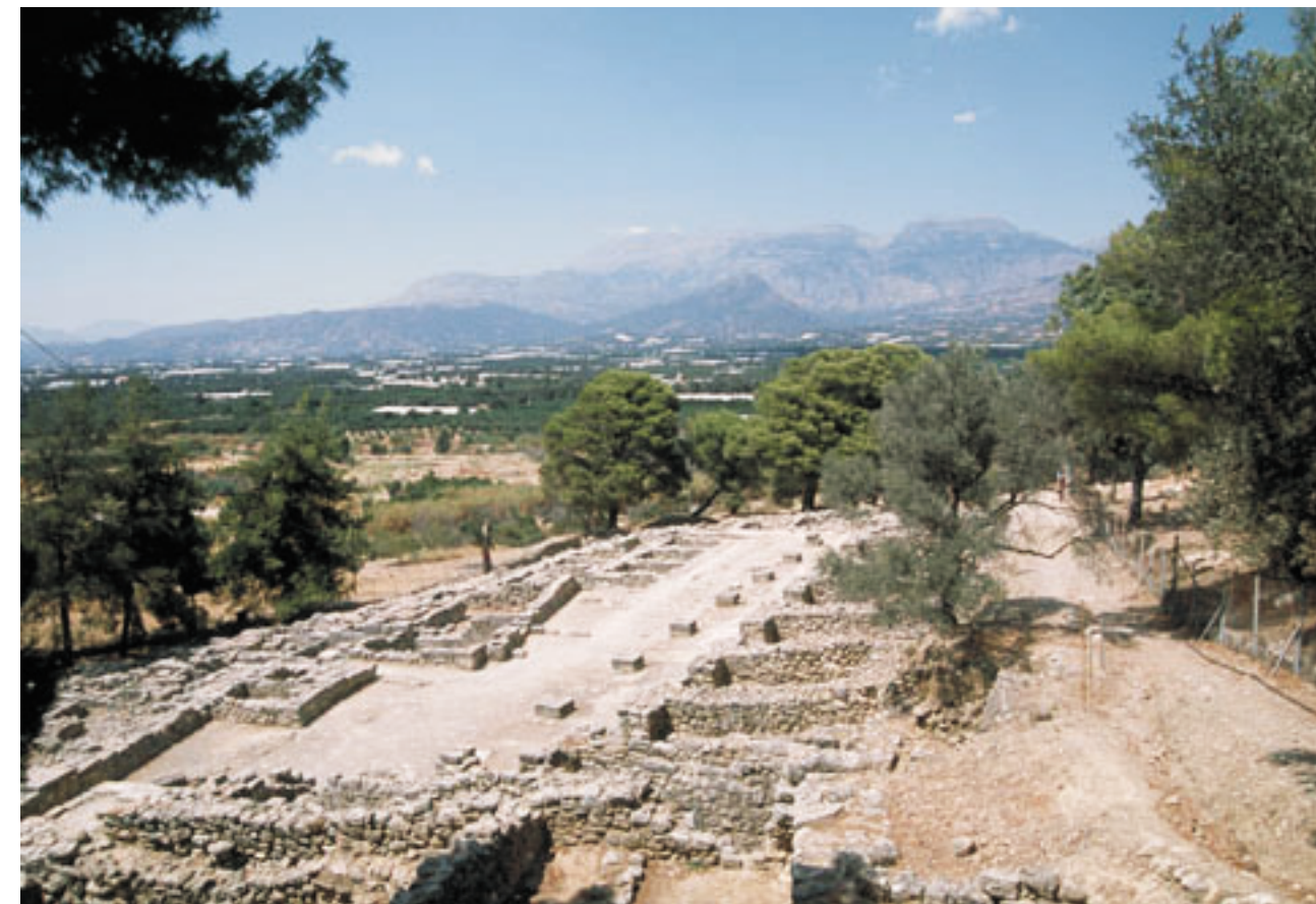
Agia Triada romjai; távolban a bikaszarvra emlékeztető Ida-hegy csúcsai (Dél-Kréta, 2006, sz.)

hatalmas udvarának főtengelye a két hegycsúcs irányába mutat. A minószi palotatervezők úgy tájolták az utcákat és a lépcsőket, hogy látni lehessen a szent hegyet (itt található a híres Zeusz-barlang). A phaisztoszi és az agia triadai sétáimon annyira magával ragadott a látvány, hogy szinte valamennyi felvételemen az Ida-hegy ikercsúcsai láthatók. A bikakultusz nem csak Krétára jellemző. A Çatal Hüyük szentélyeinek falára festett bikákat minden egyes alkalommal úgy ábrázolták, hogy a „Taurusz”, azaz a Bika-hegységgel álljanak szemben. Mellaart szerint az ábrázolásnak ez a módja tudatos cselekedet volt.