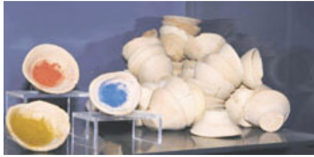
A festéshez kis kelyheket használtak a művészek (Kréta, ARM, 2006, sz.)

állatokra és a növényvilágra. A krétai művészet fejlődésének kezdetétől a figurális ábrázolásból élt. Galoppozó állatok, menetelő, táncoló emberek és a szélben mozgó növények szerepeltek a pillanatképeken. Az emberalakokat nemük szerint különböző színekkel ábrázolták: a férfiakat pirossal, a nőket sárgásfehérrel. Az archaneszi múzeum egyik vitrinjében több tucat, különböző színű festéket tartalmazó cseréptégelyt állítottak ki, be-