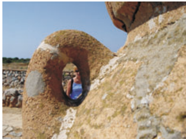
Egy nagy méretű edény füle Zsuzsival (Kréta, Knósszosz, 2006, sz.)

A klasszikus görög és a krétai kultúra különbsége nem csak az építészetben mutatkozik meg. Az archaikus görög művészetben például alig ta-