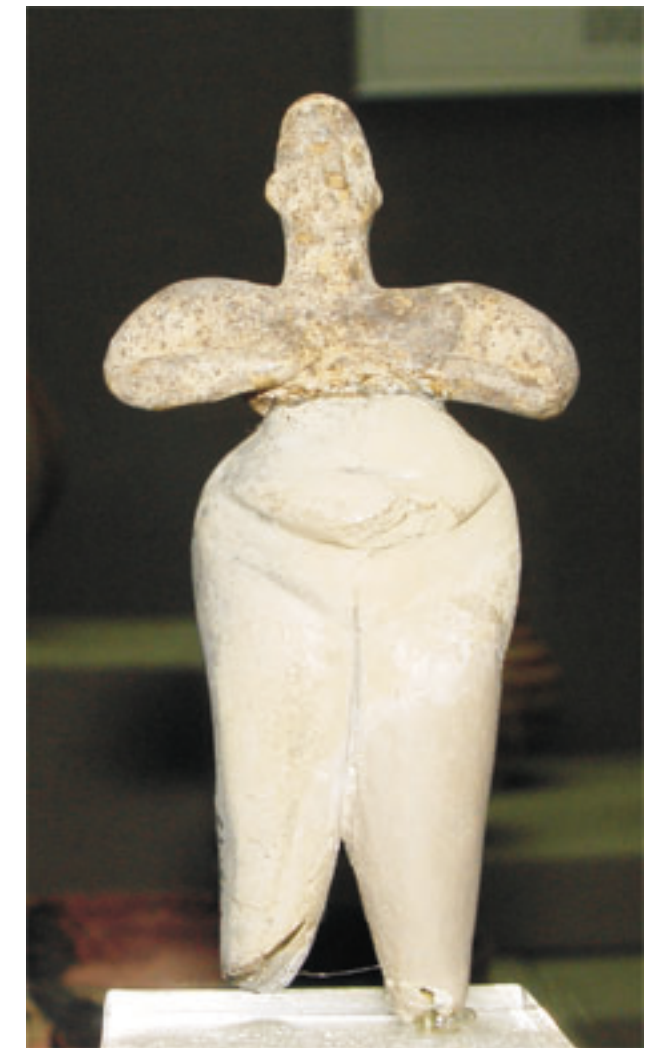
Termékenységet szimbolizáló szobor a neolitikumból (Anatólia, ARMA, 2005, sz.)

Az iskolai oktatás és a történelemtudomány túl kevés figyelmet szentel a görögöket megelőző pelaszg civilizációnak. A legtöbb tudománytörténeti munka hemzseg az olyan kifejezésektől, hogy „már a régi görögök is tudták, ismerték”. Nos, a pelaszgok bizonyos szempontból tanítómesterei voltak a görögöknek. A görögök a pelaszgok számos vívmányát átvették.