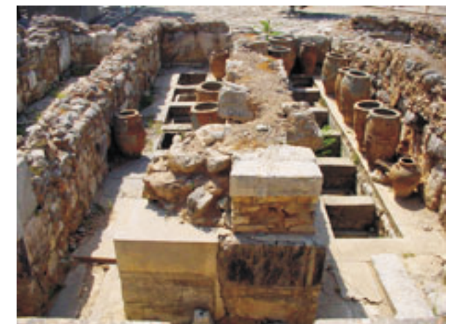
A raktárhelyiségekben hatalmas edényekben olajat, gabonát, bort tároltak (Kréta, Knósszosz, 2006, sz.)

A minószi művészetben nagy változásokat indított el a paloták átépítése. A korabeli festőknek sikerült átvinniük a mozgásvet az emberre, az