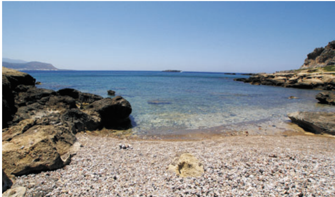
Falaszarna ókori görög várost bizarr formájú sziklák határolják (Nyugat-Kréta, 2007, sz.)