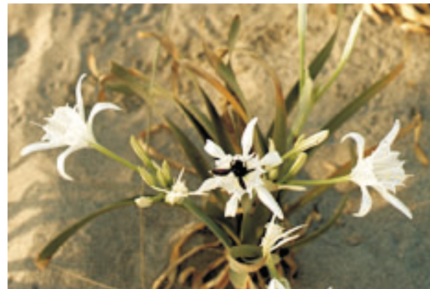
Kréta a botanikusok paradicsoma. Számos őshonos növény bújik meg a sziklák tövében (Nyugat-Kréta, 2007, AB)

szerint az északi part mentén a tengerszint 90-120 centiméterrel magasabb, mint a római időkben volt. Ezzel szemben Kréta nyugati oldala – meglehetősen késői időpontban – fölemelkedett. Ez a folyamat lassan következett be, semmi bizonyíték sincs rá, hogy az emelkedés hirtelen vagy katasztrófászerűen következett volna be. Nyugat-Kréta talajának emelkedése csak egy megnyilvánulása annak a tényezőnek, amely fontos szerepet játszott Kréta történetében. A sziget a Földközi-tenger medencéjének nagyon ingatag részén fekszik, gyakran érik földrengések, amelyek ott hagyják nyomukat a régészeti anyagban is. Bizonyára földrengések okozták azokat a hatalmas pusztításokat, amelyek a krétai bronzkori palotákat és városokat érték. 84