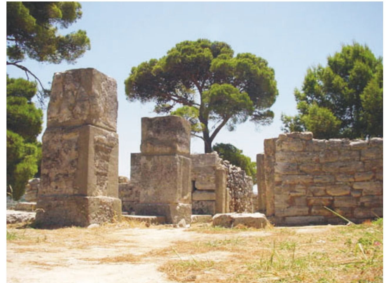
A tilisszoszi palotában 1500 évig folyamatosan laktak (Kréta, 2002, sz.)

kora lépcsős ciszterna. A régészek szerint a tilisszoszi település épületeit 1500 éven keresztül lakták. A bejáratnál egy idős mogorva ember fogadta az odaérkezőket. Zárás előtt fél órával kitesékelte bennünket a területről, bár előtte elkérte tőlünk a belépőjegyért a négy eurót. Haragja okát sikerült megfejtennem: Zsuzsa nem vásárolt a felkínált csipketerítőkből. Ettől függetlenül a bronzkori falak között sétálva fogalmat alkothattam arról, milyen körülmények között éltek a minósziak a tilisszoszi palotában. A pithoszok (agyagedények) néhol darabokban hevernek a falak mellett. Mindenütt látszik az elhanyagoltság. Többet érdemelne ez a régészeti terület!