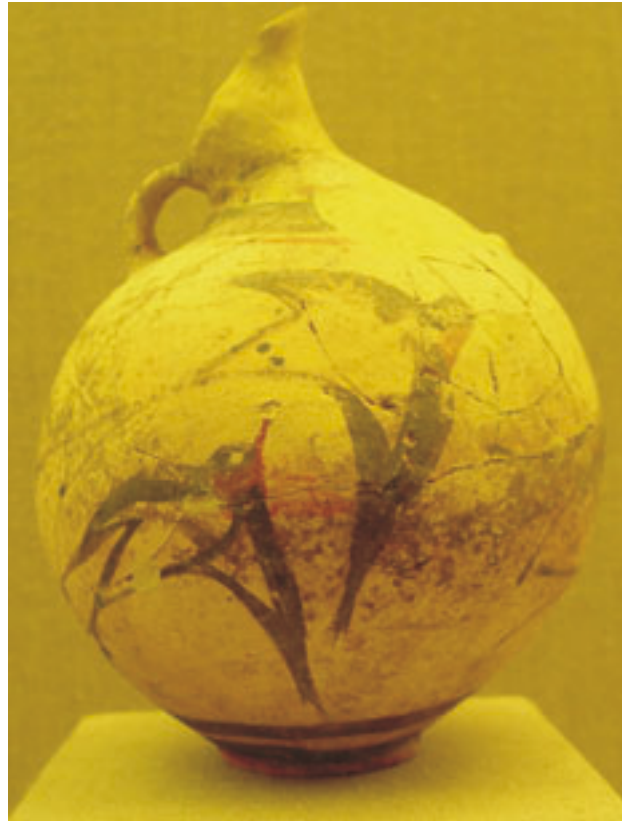
Csigaházat utánzó kancsó???

Hasonló élményben volt részem Lefkasz szigetén (Itaka), amikor egy legelésző bakkecskéről akartam videofelvételt készíteni. Az állat iszonyatosan felbőszült, amiért behatoltam territóriumába, dühösen rám rontott. A félelem olyan teljesítményt váltott ki belőlem, hogy magam is csodálkoztam: minden gond nélkül átugrottam egy