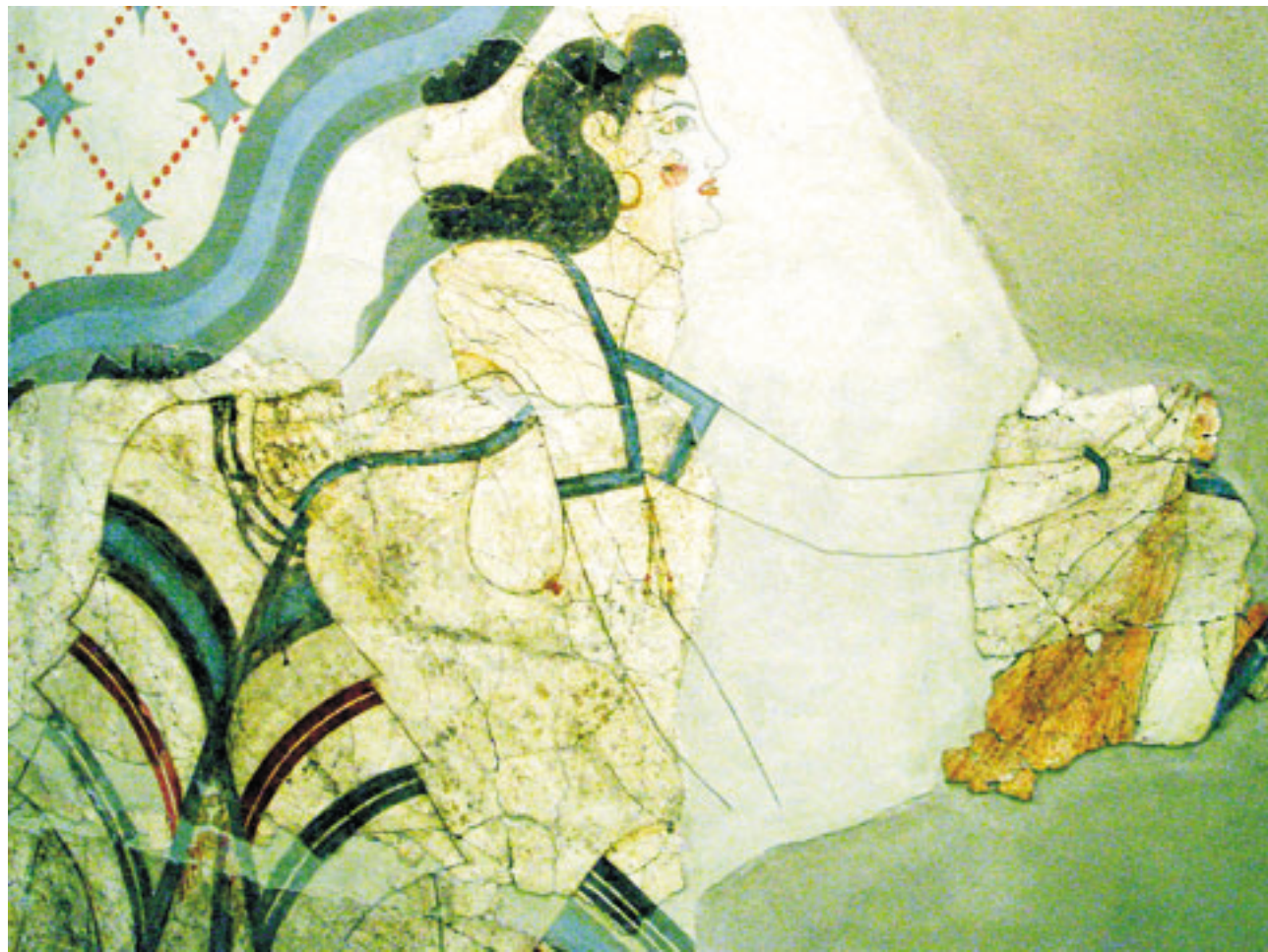
A pirosított arcú és ajkú, lebbenő szoknyájú és igen karcsú női figurát egy csillagdíszes fríz alatt ábrázolta a festő (Szentorini, FMPT, 2005. sz.)

A minószi hölgyeknek fejlett kozmetikai ismereteik voltak. Számos festékes tégely került elő a korabeli sírokból, amelyekből még a kozmetikumok összetételét is sikerült meghatározni. Az illatszerek egy részét Egyiptomból szereztek be, mint például a fekete galenitit (ólom-szulfid), amelyet