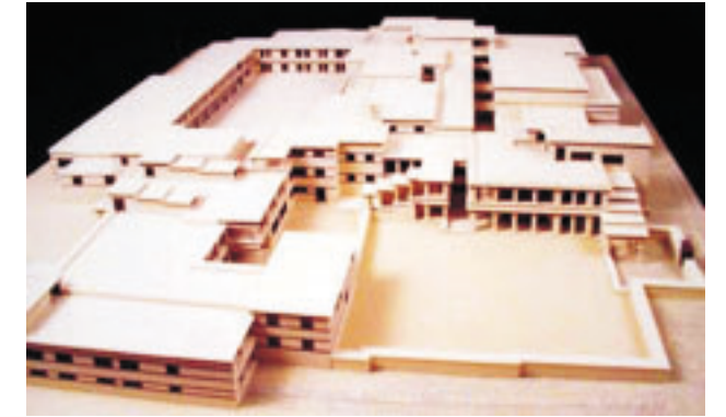
A mállai palota egy részlete maketten (Kréta, 2006, sz.)

Az ipar fenntartásához szükséges fémek importálása, a mezőgazdasági termékek kivitele az erős hajóhadra támaszkodott. A cserekereskedelem lehetővé tette egy kifinomult, városias civilizáció kialakulását. A kedvező körülmények elősegítették a népesség gyors szaporodását, bővültek emberi erőforrásaik, ami új igényeket támasztott a hatékony kormányzás és a nagyobb szervezethez iránt. Evans több tízezerre becsülte Knósszosz lakóinak számát, de ha Amnisszosz közeli kikötőjének népességét is hozzáadjuk, akkor a város akár