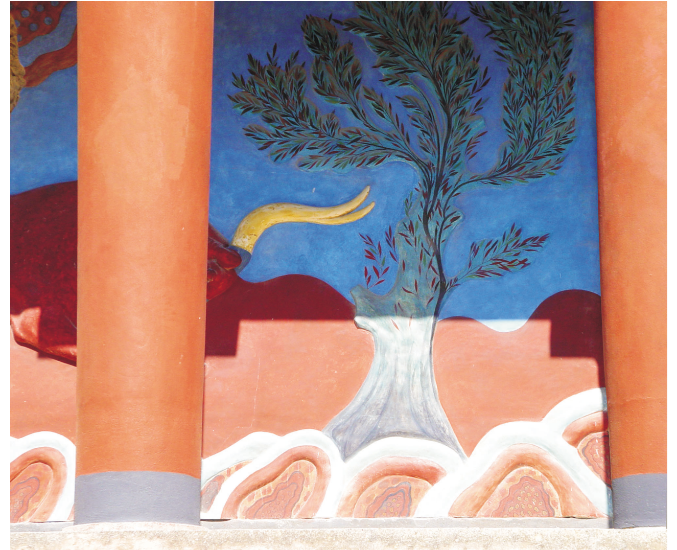
A „támadó bika” felújított domborműve (Kréta, Knósszosz, 2006, sz.)

A palota falait eleven színekben pompázó freskók, szimbolikus jelentésű spirálok és delfinek borították be. Az életöröm krétai jelképei voltak ezek az ábrázolások. Festményeiken érezni lehet a magabiztosságot: tudatosult bennük a jólét. Egy éhez, egzisztenciális gondokkal küszködő nép képtelen lenne életvidám freskókat festeni. Csodálatos falfestményeiken az elmúlt idők pillanatképei elevenednek meg. Mintha egy filmet néznénk freskóik láttán, melyekről hiányoznak a háborút istenítő motívumok. Nincsenek olyasféle jelenetek, amelyekben ragadozókat üldöznek vakmerő vadászok, de hiányoznak a harciszekér-ábrázolások is, pedig Mükénében vagy Egyiptomban gyakran találkozunk vadul vágató lovakkal. Csak a Théra vulkán kitörése után műkénéi hatásra kezdik felváltani harci jelenetekkel ezeket a békés ábrázolásokat.