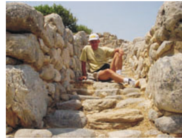
Gournia a legjobb állapotban megmaradt krétai város a bronzkorból. Lépcsőjén megpihenni különös élmény volt számomra (Kréta, 2002, Zsuzsa)

Ciprus már a neolitikumban közvetítő szerepet játszott Kis-Ázsia és Kréta között mivel közelebb volt Anatóliához. Afrodité szigete nem nagyobb három magyarországi megyénél. Feltártak egy kilencezer évvel ezelőtti újkőkori falut Choirokoitiában, ahol a házak kör alakúak és lapos tetejűek voltak. Búzákat és árpát termesztettek, birkát, kecskét és disznót tenyésztettek az ottaniak. Ők, akik itt éltek néhány ezer éven át, már a csiszolt kőkori fejlett civilizációját képviselték. A kutatók ma sem tudják pontosan, honnan érkeztek Ciprusra, és hová tűntek el.