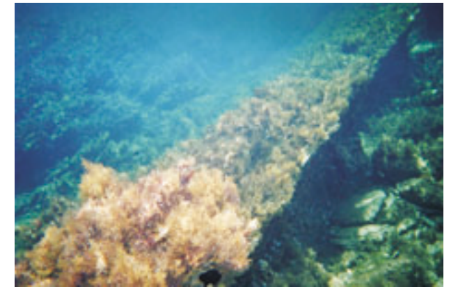
Tengerbe süllyedt palotafal Mochloszban, körülbelül 3–5 méter mélységben fekszik a szorosban (Kréta, 2002, sz.)

tettek evezőkkel és kabinokkal ellátott bonyolultabb hajókat, és korán megindult a kereskedelem a többi országgal. Az Újbirodalom idején speciális hadihajókat építettek, és számos újítást vezettek be. Ezt követően a flotta nem sokat változott egészen a XXVI. dinasztia idejéig (Kr. e. 600 körül), amikor is az egyiptomiak által alkalmazott görög és föníciai zsoldosok számos új elemet hoztak magukkal. Ez idő tájt az egyiptomi haditengerészetben még az ún. kenput (azaz bübloszi) és keftiu (azaz krétai) hajók játszottak szerepet. 44 Az egyiptomiak kiépítették egy hajózható csatornát a Vörös-tenger és a Nílus között, amelyről később a száiszi és a perzsa korban hallunk újra. A szuezi csatornának ez az ókori változata nem közvetlenül kötötte össze a Földközi- és a