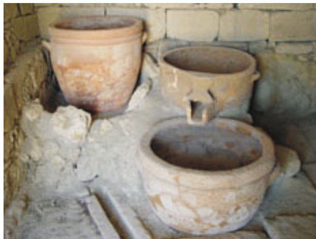
A vathipetrói szőlőprés még ma is vita tárgya: olajat vagy szőlőt préseltek vele! (Kréta, 2006, sz.)

Egy alkalommal, amikor a királyi palotában a tömeg hullámozása már-már kezdett elviselhetetlen lenni, elballagtam Evans szobra felé. Jellegzetesen angol arc nézett rám. Egy kicsit irigyeltem őt. Megszállott ember volt, hitt a maga igazában. Milyen sok titkot fedezett fel a romok mélyén! Sajnos nem tudom feltenni az öregúrnak a kérdést: miért fogadja el oly nehezen a világot, hogy Atlantisz és a minószi birodalom egy és ugyanaz? Miért főbenjáró bűn, ha valaki ki meri mondani, hogy a minószi Atlantisz Európában, az Égeikumban és