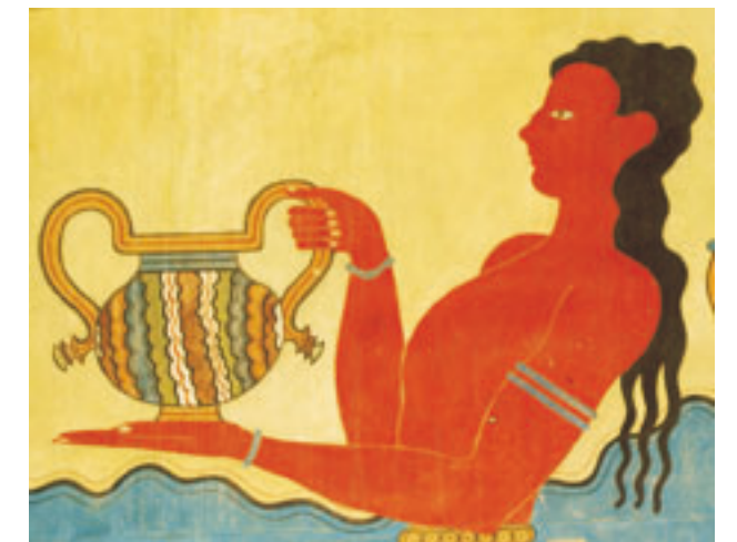
A férfiak alacsony termetű, borotvált képű, karcsú derekú emberek voltak. Kezüik, lábuk kicsi; a mellkasuk fedetlen volt (Kréta, Szantorini, sz.)