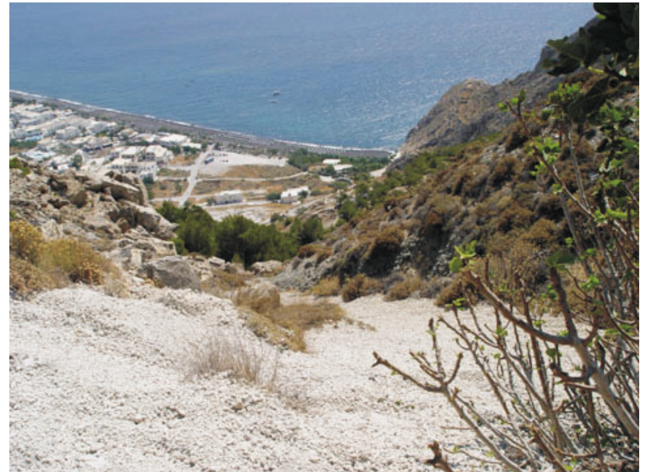
A „habkőlavina” a tengerbe jutva még ma is elérheti Krétát (Szantorini, Mesza Vouno-hegy, 2005, sz.)

Azok a pillanatok a legértékesebbek, amikor az ősfű között futkározó gyíkok és a körülöttem repkedő lepkék, darazsak életét lencsevégre kaphatom. Lábujjaimat toklász csiklandozza, saját szívhangomat hallom a rekkenő hőségben, ajkam kicserepesedik, arcomon szenvedés ül, mégis boldog vagyok magányomban, amint az ismeretlen kultúra emlékeit kutatom. Szerző 138