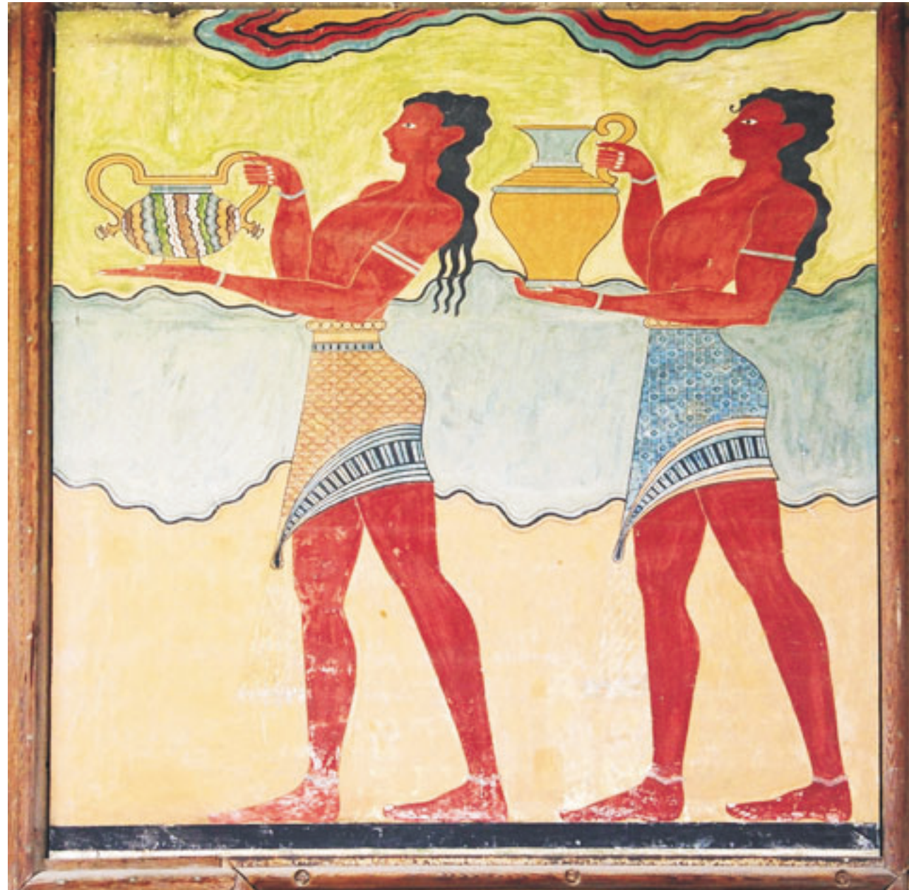
A palota impozáns, oszlopos főbejáratát az Edényvivők freskó díszíti (Kréta, Knósszosz, 2006. sz.)

Négyezer éve, amikor az észak-európaiak még kezdetleges kunyhókban laktak, Krétán pompás, falfestményekkel díszített palotákat építettek a minósziak, amelyekről a régészeti ásatások eredményeiből szerezhetett tudomást a világ. Barbara Metzmacher–Ralf Adler 134