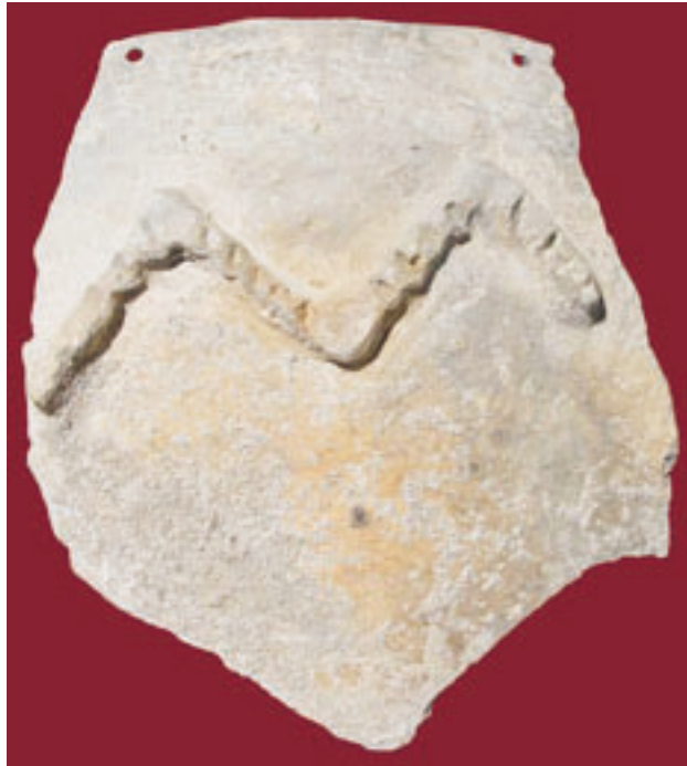
Egy M alakú, bevagdalt, bordadísszel ellátott edénytöredék Kéthalomról (Késő Szakálhát vagy korai Tisza-kultúra »Kalicz«, sz.)

nem láttak még puztát, tűzokot. Megismerkedtek az alföldi gasztronómiával, az igazi gulyással, a kemencében sült lángossal, a halászlével és a palacsintával. Megízlelték a puztai pálinkát, és táncoltak a magyar népzeneire. A görögök elragadtatással beszéltek országunkról, kultúránkról, különösen arról, hogy a Kárpát-medencében 7-8 ezer évvel ezelőtt már szép rajzolatú szobrokat és edényeket készítettek az újkőkori elődök.