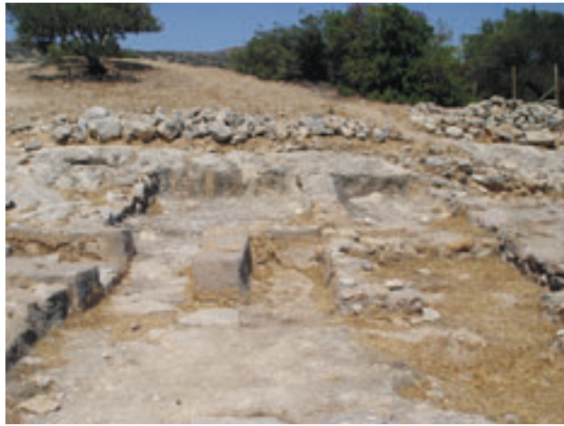
Sziklába vésett házalap Vaszilikiben (Kelet-Kréta, 2006, sz.)

A Kr. e. III. évezred közepén a kelet-kréta tengerpartot és környékét kőből épült falvak lepték el. Ezek, valamint a többi középkor és dél-kréta település a földművelés, a gazdaság és feltehetően az építészet terén a minószi paloták hétszáz évvel korábbi ősei. Peter Warren 198