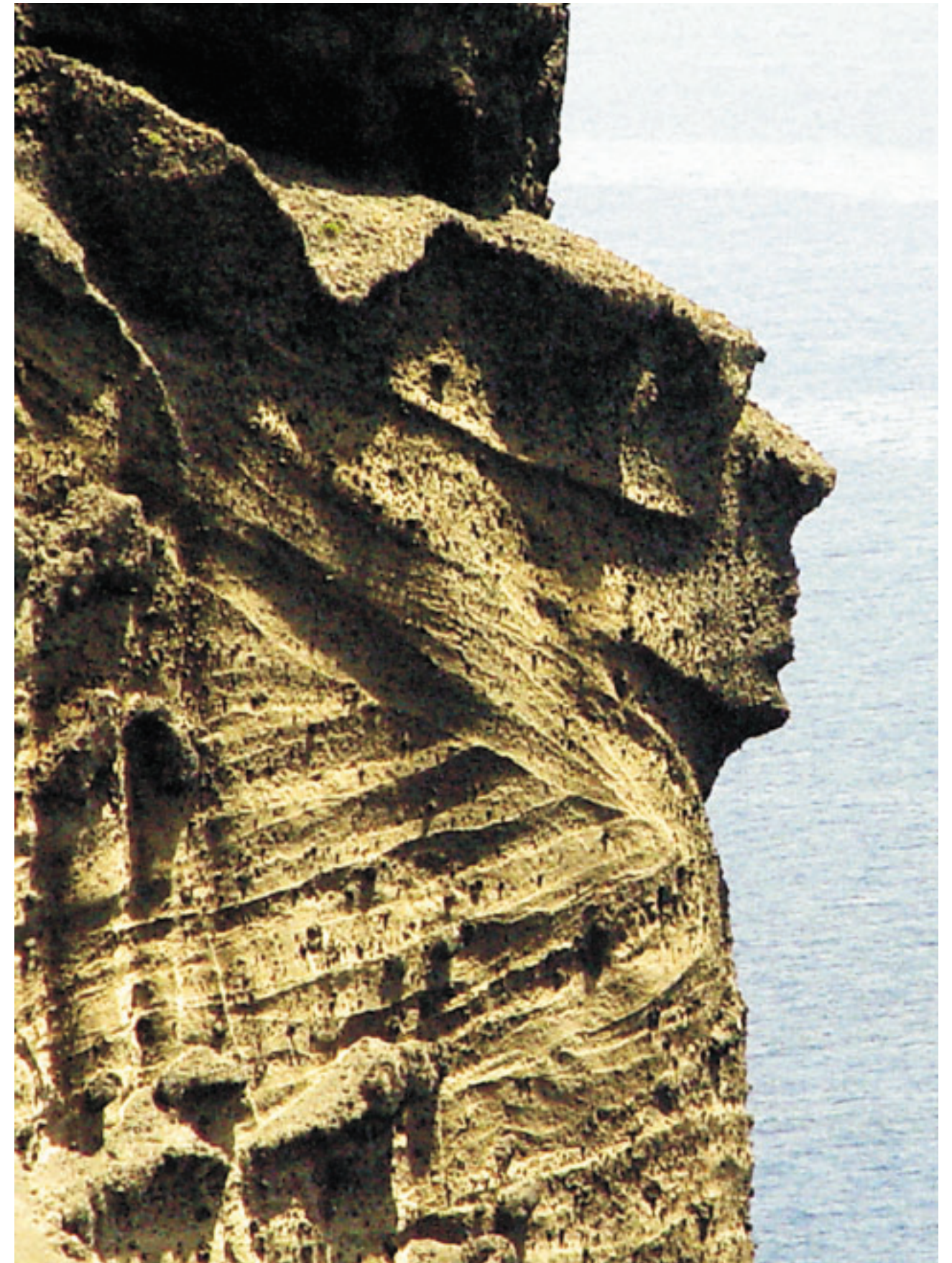
A Kréta felé tekintő sziklaarcot vajon a természet alakította ilyené? (Szantorini, Akrotiri-fok, 2004, sz.)