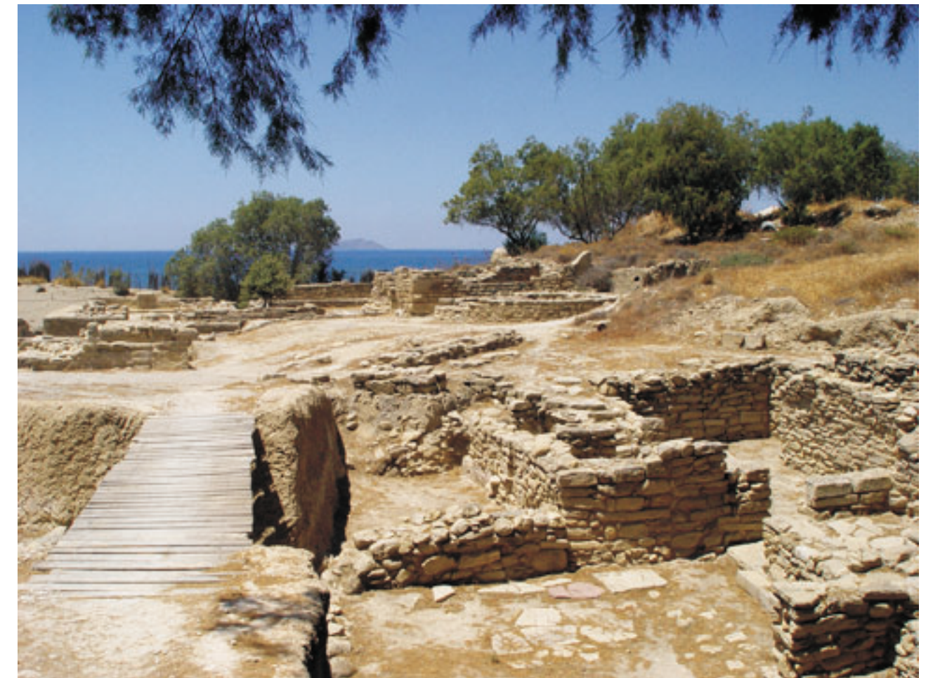
A fővény alatt nyugszik Kommosz, a bronzkor egyik legnagyobb kikötője, amelyet a Phaisztosz és Agia Triada körülípa lotaközpontok használtak Kr. e. 1650 és 1250 között. Később a műkénéiek a kikötőt átépítették (Dél-Kréta, 2006, sz.)