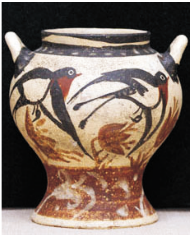
Akrotiriben a művészek gyakran festettek fecskéket az edényeikre (Szantorini, FMPT, 2004, másolat, sz.)

állatokra és a növényvilágra. A krétai művészet fejlődésének kezdetétől a figurális ábrázolásból élt. Galoppozó állatok, menetelő, táncoló emberek és a szélben mozgó növények szerepeltek a pillanatképeken. Az emberalakokat nemük szerint különböző színekkel ábrázolták: a férfiakat pirossal, a nőket sárgásfehérrel. Az archaneszi múzeum egyik vitrinjében több tucat, különböző színű festéket tartalmazó cseréptégelyt állítottak ki, be-