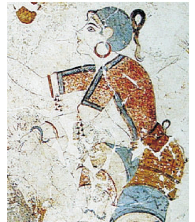
Sáfrányt gyűjtőgető nők (Szentorini, OMA, 2005, sz.)