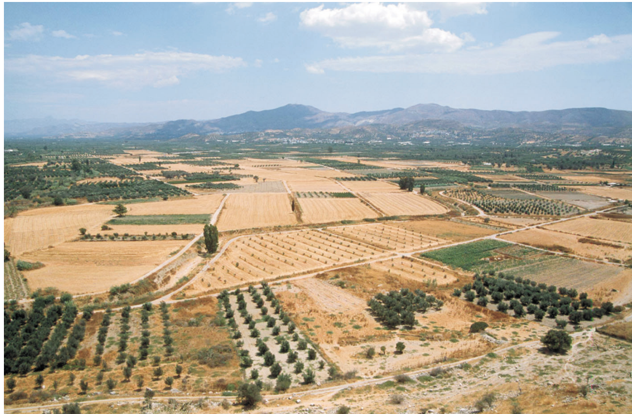
Aratás ideje a Messzara-síkságon, amely a minószi időkben is Kréta éléstára volt (Kréta, 2006, sz.)

A korai kultúra központja a termékeny Messzara-síkság volt. Evans szerint ez idő tájt már ismerték a kőírást. Fellendült a hajózás és a kereskedelem Kis-Ázsiával, Mezopotámiával és Egyiptommal. A mindennapi élet is sokat változott: a krétaiak már vakolt falú házakban laktak, halottaikat kupolasírokba temették el.