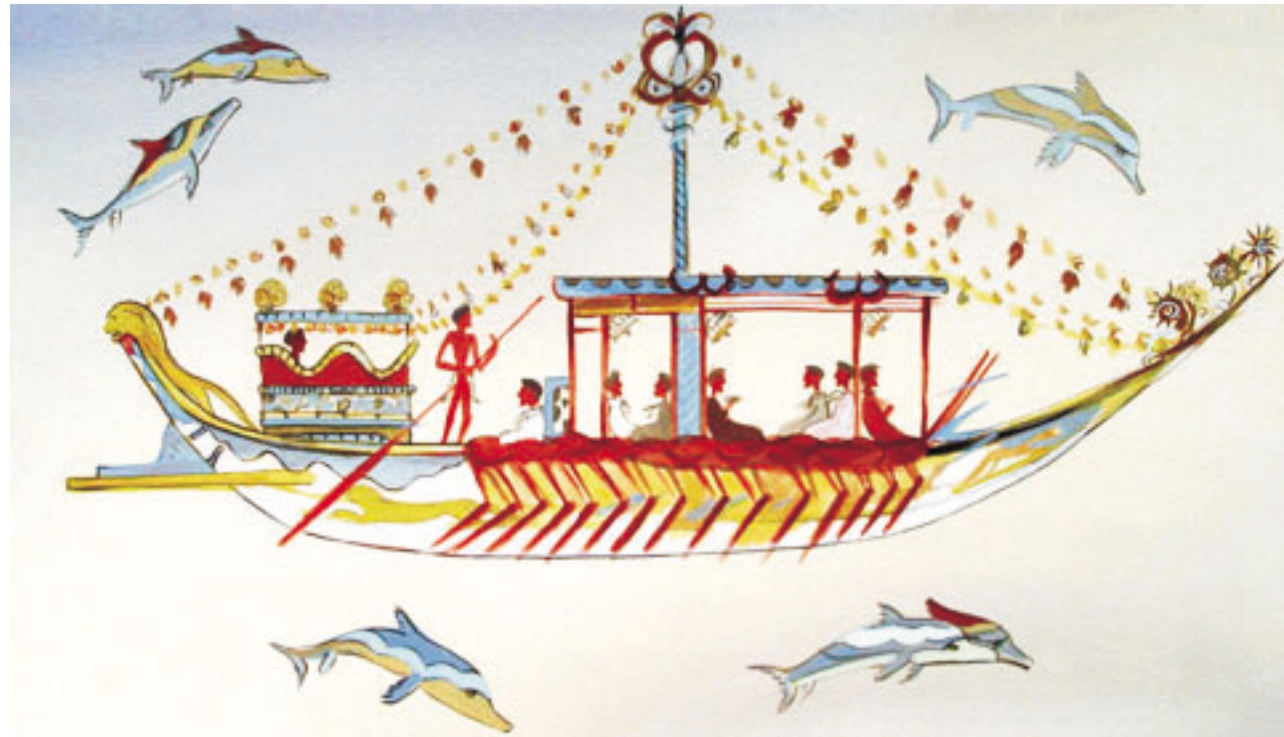
Akrotiri hajó vázlatos rajza (CSBA)

A nők egy sor szerepkörben átvették az irányítást a krétai társadalom életében. Az egyik rajzon a hölgyek fiatal fiúk beavatási szertartásán vesznek részt. A fiúk tülekednek, hogy elsőként kerüljenek a hölgyek elé. A közelben egy emelvényen babérkoszorú látható.